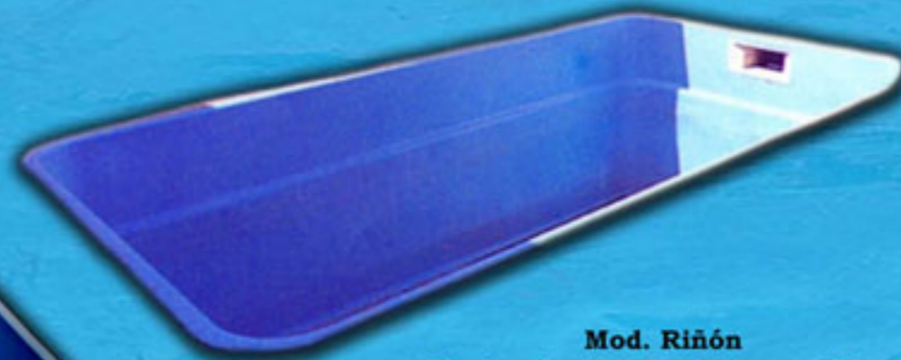
Mod. Riñón Piscina de 2,5m. x 1,6m. x 0,50m.