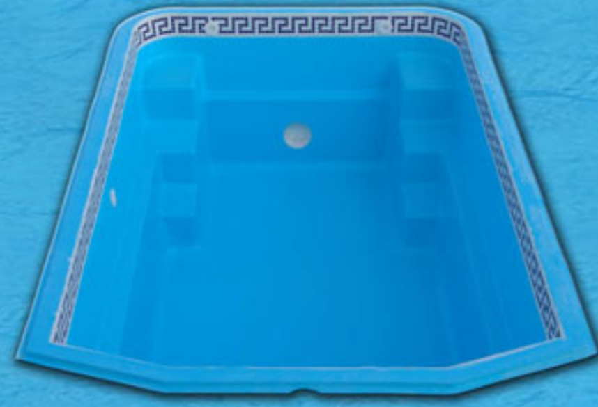
Mod. Rectangular Piscina de 4m. x 2,50m. x 1,25m.