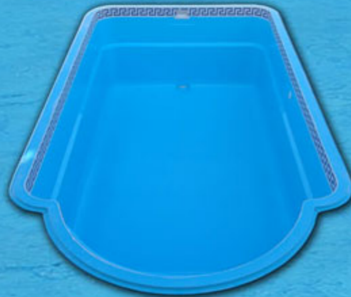
Mod. Romana Piscina de 10m. x 4m. x 1,15m. a 1,90m.