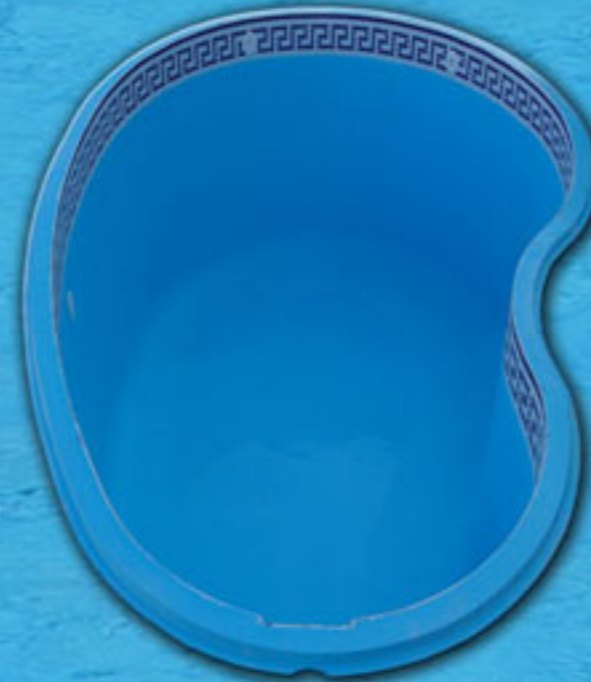
Mod. Riñón Piscina de 4,5m. x 3m. x 1,30m.